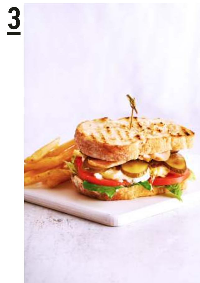
1 БРУСКЕТТА С ЛОСОСЕМ НА ДЕРЕВЕНСКОМ ХЛЕБЕ 430.-

Поджаренный кусочек хрустящего деревенского хлеба с семечками, нежным сливочным муссом, слабосоленым лососем, помидорами конкассе и каперсами. По вашему желанию может быть приготовлена на черном багете.