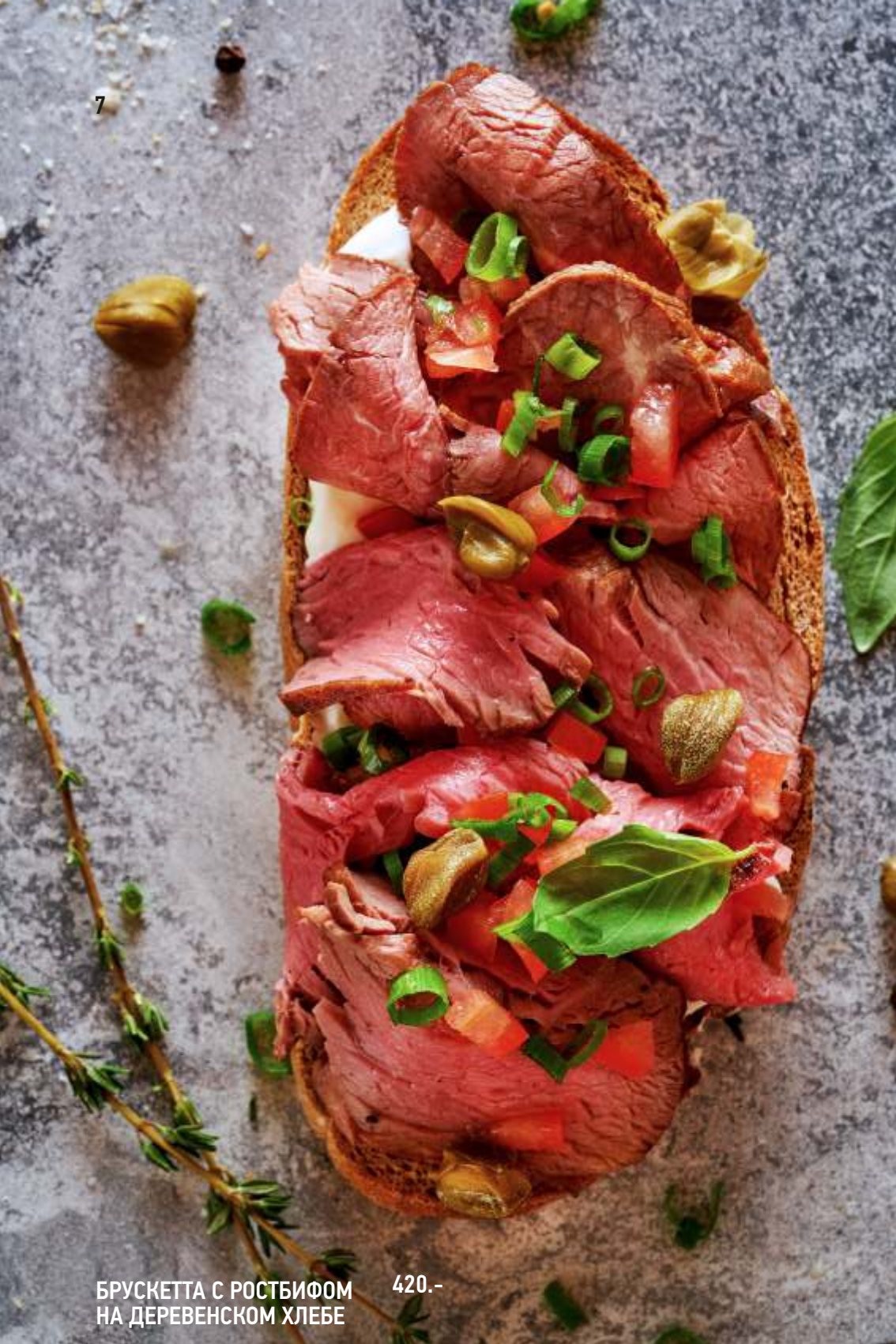
БРУСКЕТТА С РОСТБИФОМ НА ДЕРЕВЕНСКОМ ХЛЕБЕ 420.-

Поджаренный кусочек хрустящего деревенского хлеба с семечками, нежным сливочным муссом, сочным ростбифом, помидорами конкассе и каперсами. По вашему желанию может быть приготовлена на черном багете.