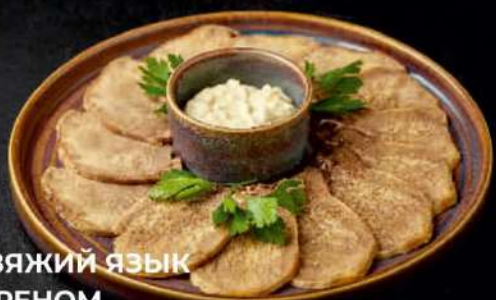
ГОВЯЖИЙ ЯЗЫК С ХРЕНОМ 150/30гр