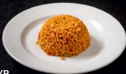
БУЛГУР С ОВОЩАМИ