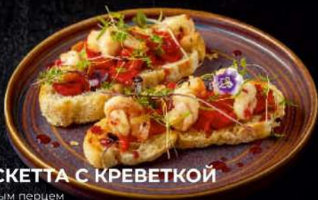
БРУСКЕТТА С КРЕВЕТКОЙ