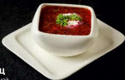
БОРЩ со сметаной 300 мл