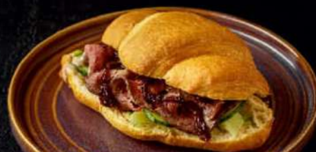
КРУАССАН С РОСТБИФОМ 200гр