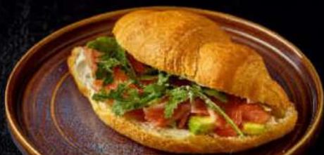
КРУАССАН С СЁМГОЙ и авокадо 200гр