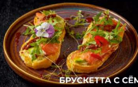
БРУСКЕТТА С СЁМГОЙ