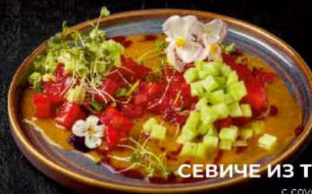
СЕВИЧЕ ИЗ ТУНЦА с соусом манго 230гр