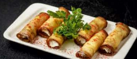
РУЛЕТКИ ИЗ БАКЛАЖАН