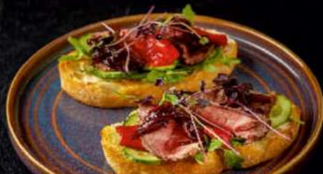
БРУСКЕТТА С РОСТБИФОМ