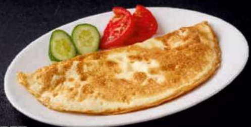
ОМЛЕТ Из 2-х яиц