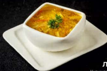
ЛАПША Куриная домашняя 300 мл